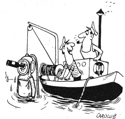
«Ich weiss nur, dass er plötzlich einen Korkenzieher verlangte.»

Zürich. Katholischer Gottesdienst: Sonn-tag, den 4. Mai, 10 Uhr (ab 9 Uhr Beicht-gelegenheit) in der Gehörlosenkirche, Oer-likonerstrasse 98. Anschliessend Aperitif im Klubraum des Gehörlosenzentrums. Alle Gehörlosen sind herzlich eingeladen!