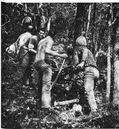
Glarner Gehörlose im freiwilligen Arbeits-einsatz für ihr Berghaus Tristel: Holz-rüsten im Gemeindewald.