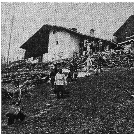
«Lebt wohl, und kommt bald wieder ein-mal!» Gehörlose Gäste nehmen Abschied vom heimeligen Berghaus.

tigt. Ich habe auf der Wanderung den Teilnehmern Auskünfte gegeben, was vor 175 Jahren bis heute im Sernftal ge-schehen war.