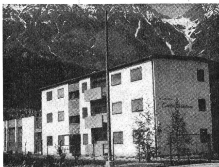
Haus der Tiroler Gehörlosen

In dem weitläufigen Gebäudekomplex findet man ein Foyer mit Garderobe, einen Klubraum für 60 Personen, einen Saal mit Bühne für 200 bis 250 Personen und Büros für die Gesellschaft zur Förderung der Hör- und Sprachgeschädigten und den Landesverband Hamburg. Im Erdgeschoss sind zwei Kegelbahnen und sonstige Räume, und schliesslich befinden sich im ersten Stock Wohnungen für 15 gehörlose Familien. — Die Baukosten betrugen rund 2,2 Millionen DM. Sie wurden hauptsächlich durch die Initiative von Herrn Dr. Feuchte aufgebracht. Die Stadt Hamburg steuerte aus Lotto- und Totomitteln eine Million DM bei. (Aus: G.-Taschenkalender 1974/75.)