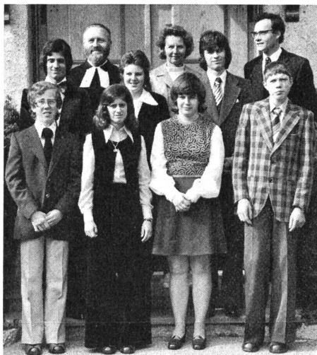
31. März 1974: Konfirmation Münchenbuchsee