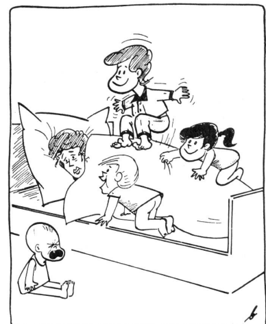
Mutti, willst du heute einmal ausschlafen?