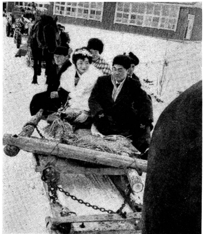
Fast wie bei uns in verschneiten Berggebieten: Ein neuvermähltes Paar startet mit Schlitten zu einer kleinen Hochzeitsreise.

Die Japaner sind ein fleissiges, arbeitsames Volk. Sie feiern aber auch gerne Feste. In