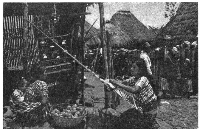
Indianische Frau beim Weben an ihrem sehr einfachen «Webstuhl». Schade, dass wir die buntfarbigen Tücher nicht in einem Farbbild zeigen können.

Nun sausen wir weiter. Wir erreichen nach