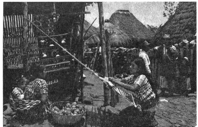
Indianische Frau beim Weben an ihrem sehr einfachen «Webstuhl». Schade, dass wir die buntfarbigen Tücher nicht in einem Farbbild zeigen können.

Nun sausen wir weiter. Wir erreichen nach