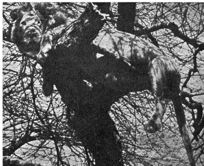
Den Bauch vollgefressen, faul und träge — und in luftiger Höhe in Sicherheit vor Plagegeistern der afrikanischen Steppe.

Noch schlimmere Plagegeister sind die 5 bis 8 Millimeter grossen Tsetsefliegen. Sie schwirren nur in geringer Höhe bis zu einem Meter über dem Erdboden umher. Sie haben keinen Respekt (keine Hochachtung) vor dem König der Tiere. Sie surren um seine Augen, seine Nüstern (Nasenlöcher) und sogar in seinen Ohrmuscheln. Dieses Surren kann ihn ganz verrückt machen.