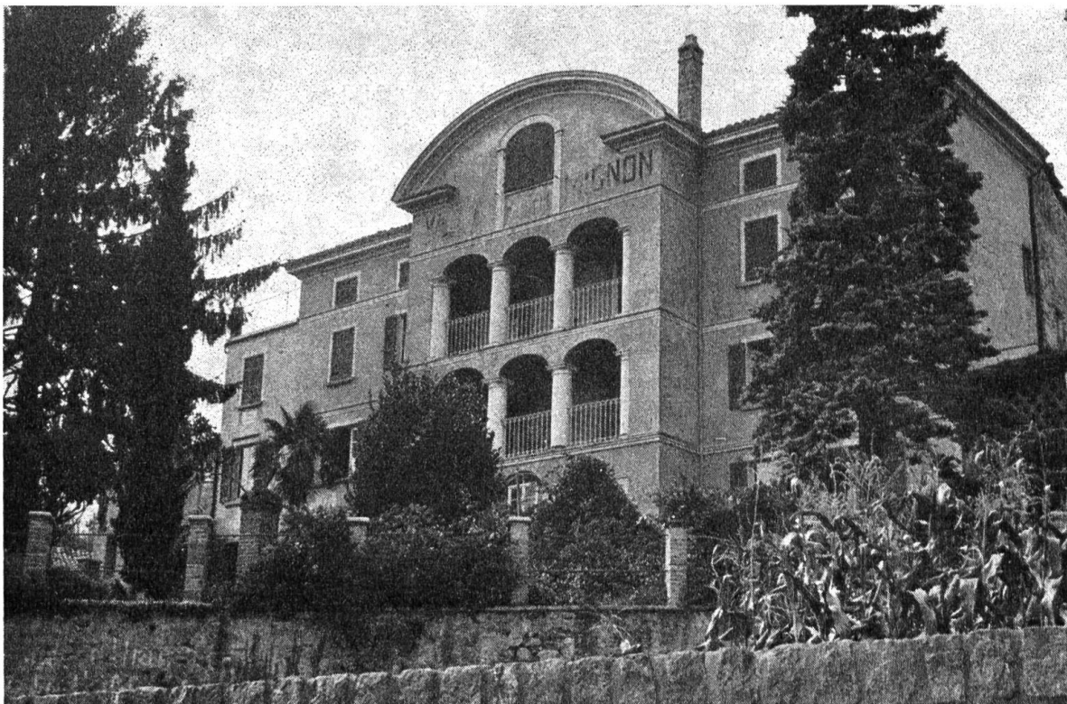
Ist es nicht ein stolzes Haus?