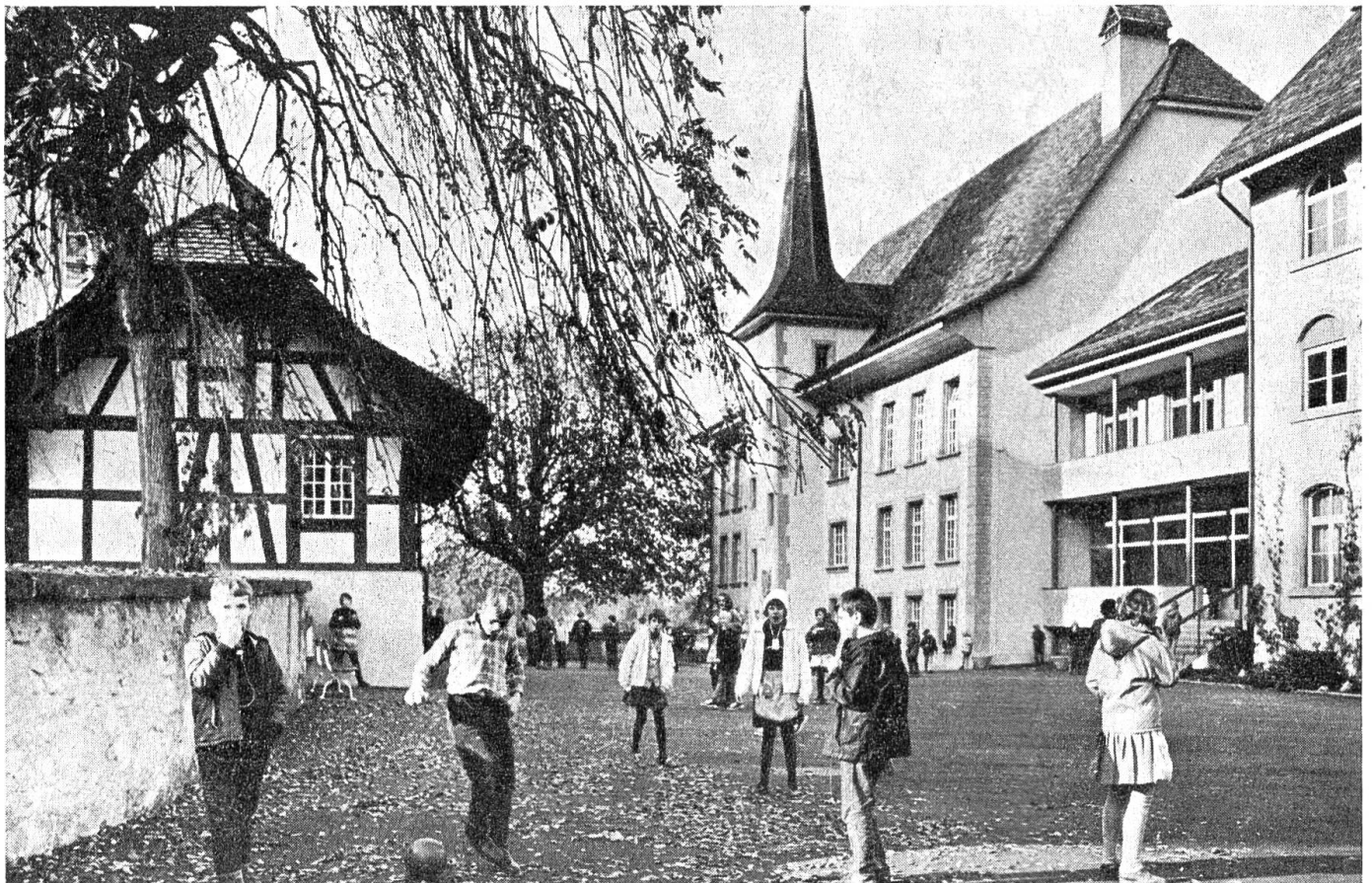
Unser Bild zeigt in der Mitte das Knabenhaus (Schloß), am Bildrand rechts das Schulhaus, dazwischen Eingangshalle und über ihr die Krankenabteilung. Links im Vordergrund ist das ehemalige «Küherhaus» zu sehen und dahinter die östliche Giebelfront des Gebäudes, in dem sich u. a. der neue Festsaal befindet.

Rund 350 Jahre später, im Jahre 1527, nahm der reformiert gewordene Staat Bern dem Johanniterorden den Schloßbesitz weg. Er richtete dort eine Landvogtei ein. Dann kam die schlimme Zeit, wo die Franzosen Bern besetzten und in unserem Lande Franzosen gegen Österreicher und Russen kämpften (1798—1802). Die Gebäude des Schloßbesitzes dienten nun als Spital für verwundete und kranke Soldaten. Nach der Franzosenzeit durfte Heinrich Pestalozzi dort Kinder erziehen und unterrichten. Zwei Monate später wurde Mün-