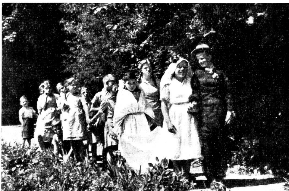
Auch sie lieben es, sich zu verkleiden. Hochzeitszug im Garten

gewiesen, denn die Kostgelder mit rund Fr. 62 000.— decken die Ausgaben nicht einmal zur Hälfte (Fr. 166 000.—).