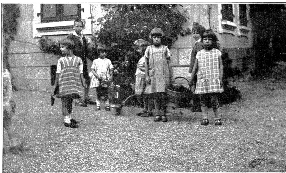
Kindergarten für Taubstumme in Genf.