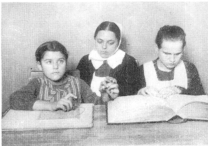
Schreib- und Lesunterricht der Taubstummblinden.

feierte, eine Abteilung für taubstummblinde Kinder angegliedert. 1912 konnte hier für diese Kinder ein besonderes Heim gegründet werden, das Raum für sechzig Zöglinge bietet. Die Methode, die dort bei dem mühsamen Unterricht angewendet wird und einzelne Momente aus dem Leben der Dreisinnigen veranschaulichen unsere Bilder. Nach kurzer Gewöhnung an das Anstaltsleben werden mit den Schülern Tastübungen vorgenommen, daneben buchstabiert man dem Kinde ein volles Wort im Fingeralphabet immer wieder in die Hand. Man reicht zum Beispiel den Ball zum wiederholten Betasten und buchstabiert dazu in die Hand des Kindes das Wort. Schließlich fingert das Kind das Wort selbst nach. Es weiß nun, daß mit den Fingerzeichen von „Ball“ der Gegenstand bezeichnet ist. Es wird nun bald die Bezeichnung anderer Gegenstände verlangen. Ist dieser stumme Unterricht einige Zeit fortgesetzt, so folgt der Unterricht im Sprechen. Das Bild zeigt uns, wie der Lehrer bei einem Schüler den Laut „a“ entwickelt. Der Schüler legt eine Hand an den Kehlkopf des Lehrers, die andere Hand an seinen Kehlkopf, fühlt so die Stimme des Lehrers und versucht sie nachzubilden. Daneben betastet er die Mundstellung des Lehrers und ahmt sie nach. Wenn ihm das nicht gut gelingt, so hilft der Lehrer mit Legung der Lippen in die rechte Stellung nach. Die Übung der Einzellaute nimmt natürlich viel Zeit in Anspruch. Sind