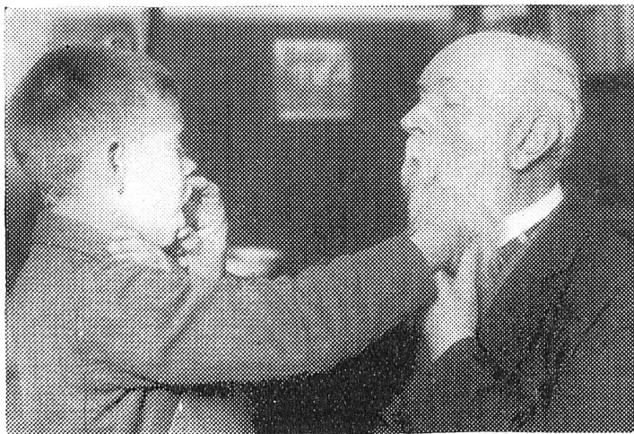
Das taubstummblinde Kind beim Sprachunterricht.

einige Laute geübt, so verbindet man sie zu Wörtern. Kann der Schüler kurze Sätze sprechen, so tritt ein einfacher Anschauungsunterricht ein, bei dem die Gegenstände betastet werden und die Lehrerin die betreffenden Sätze in die Hand der Schülerin buchstabiert, wie es das Bild darstellt. Der Unterricht ist überall Einzelunterricht, und jede Lehrerin kann nur vier bis fünf Kinder in ihrer Abteilung haben. In einem anderen Falle sehen wir eine Lehrerin mit zwei Schülerinnen, wovon die eine Blindenschrift liest und die andere nach Diktat der Lehrerin in die Hand etwas auf die Blindentafel schreibt. Diese Tafeln sind mit Killen versehen, über denen eine durchlöchernte Platte liegt, darunter legt man das Papier. Der Schüler tupft mit einem besonderen Stift in die Löcher, und auf dem Papier entstehen dadurch erhabene Punkte, die Brailleschrift. Bei einer freieren Unterhaltung kann man auch zu mehreren Kindern zu gleicher Zeit sprechen. In einer anderen Abteilung liest eine Lehrerin drei Kindern etwas vor, das die Kinder in der Mitte von Hand zu Hand weitergeben. Einzelne Kinder brachten es nach zehn- bis elfjährigem Unterricht dahin, daß mit ihnen Erzählungen gelesen werden konnten. Es sind natürlich nicht alle so weit zu fördern, da es für die meisten mehr auf die praktische Ausbildung ankommt. Die Zöglinge lernen Matten