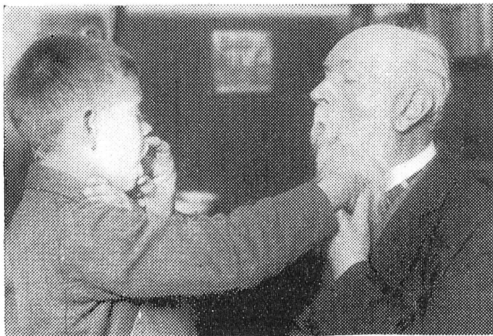
Das taubstummblinde Kind beim Sprachunterricht.

einige Laute geübt, so verbindet man sie zu Wörtern. Kann der Schüler kurze Sätzchen sprechen, so tritt ein einfacher Anschauungsunterricht ein, bei dem die Gegenstände betastet werden und die Lehrerin die betreffenden Sätzchen in die Hand der Schülerin buchstabiert, wie es das Bild darstellt. Der Unterricht ist überall Einzelunterricht, und jede Lehrerin kann nur vier bis fünf Kinder in ihrer Abteilung haben. In einem anderen Falle sehen wir eine Lehrerin mit zwei Schülerinnen, wovon die eine Blindenschrift liest und die andere nach Diktat der Lehrerin in die Hand etwas auf die Blindentafel schreibt. Diese Tafeln sind mit Rillen versehen, über denen eine durchlöchernte Platte liegt, darunter legt man das Papier. Der Schüler tupft mit einem besonderen Stift in die Löcher, und auf dem Papier entstehen dadurch erhabene Punkte, die Brailleschrift. Bei einer freieren Unterhaltung kann man auch zu mehreren Kindern zu gleicher Zeit sprechen. In einer anderen Abteilung liest eine Lehrerin drei Kindern etwas vor, das die Kinder in der Mitte von Hand zu Hand weitergeben. Einzelne Kinder brachten es nach zehn- bis elfjährigem Unterricht dahin, daß mit ihnen Erzählungen gelesen werden konnten. Es sind natürlich nicht alle so weit zu fördern, da es für die meisten mehr auf die praktische Ausbildung ankommt. Die Zöglinge lernen Matten