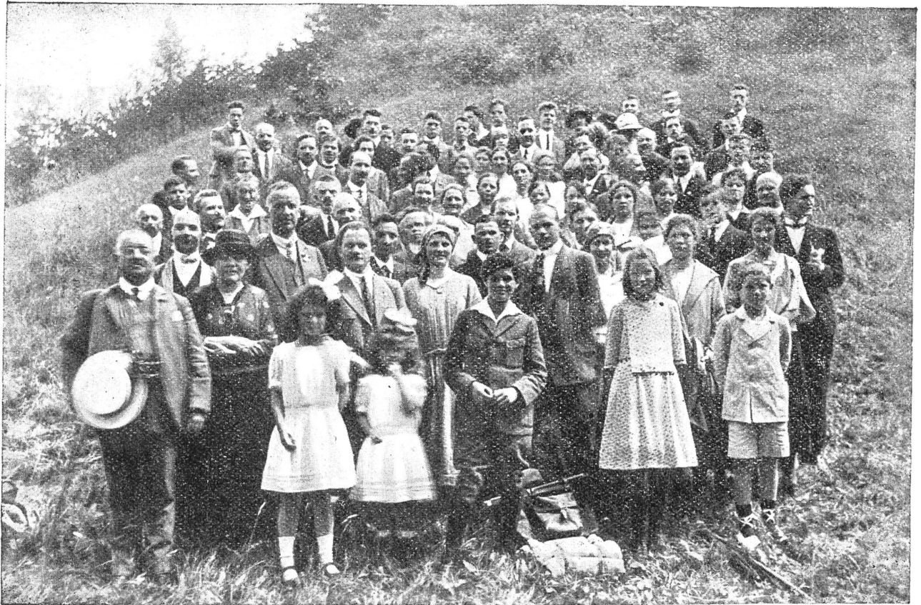
Mitglieder von den vier Taubstummenbunden Basel, Bern, Burgdorf und Biel.

Am 1. Juni auf der Petersinsel im Bielersee.