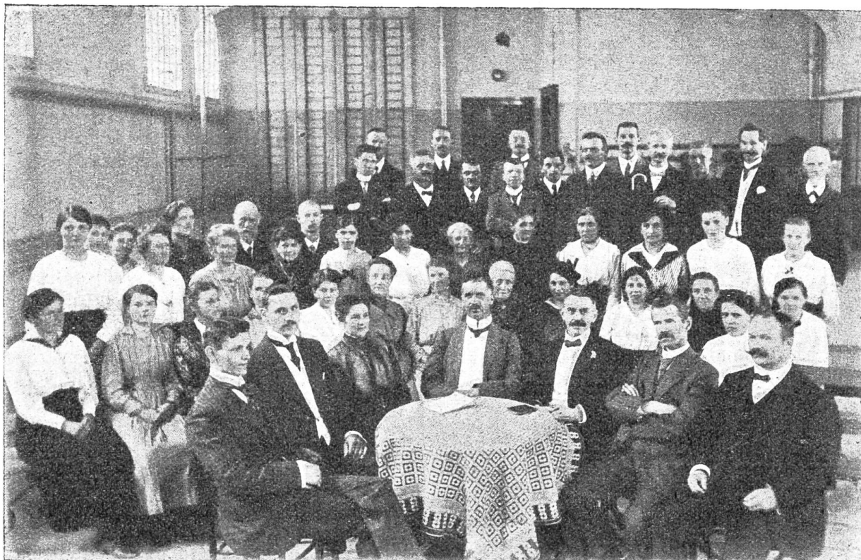
„Taubstummengemeinschaft und Reiseklub Basel.“

Wir hoffen also auf Wiedersehen und sagen allen Veranstalterinnen der genossenen schönen Stunden herzlichen Dank.