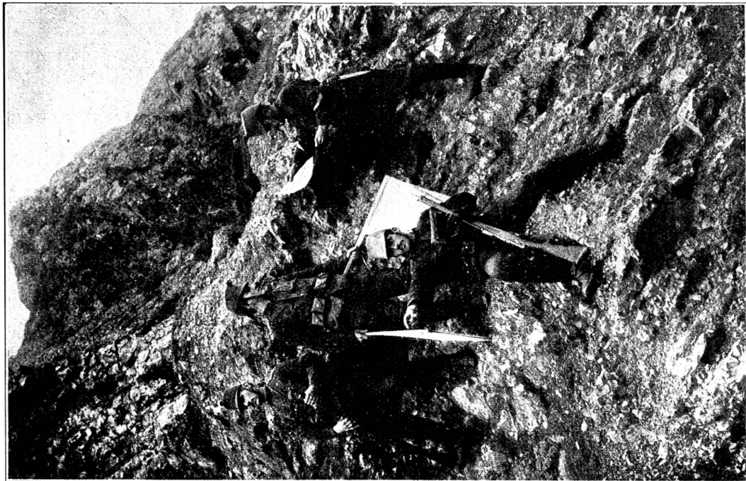
Selbständiger Beobachtungsposten beim Signalisieren.

Bei sehr mühsam und schwierig zu begehenden Wegen werden wichtige Meldungen durch diesen Hilfsdienst nach der Hauptwache hinunter befördert.