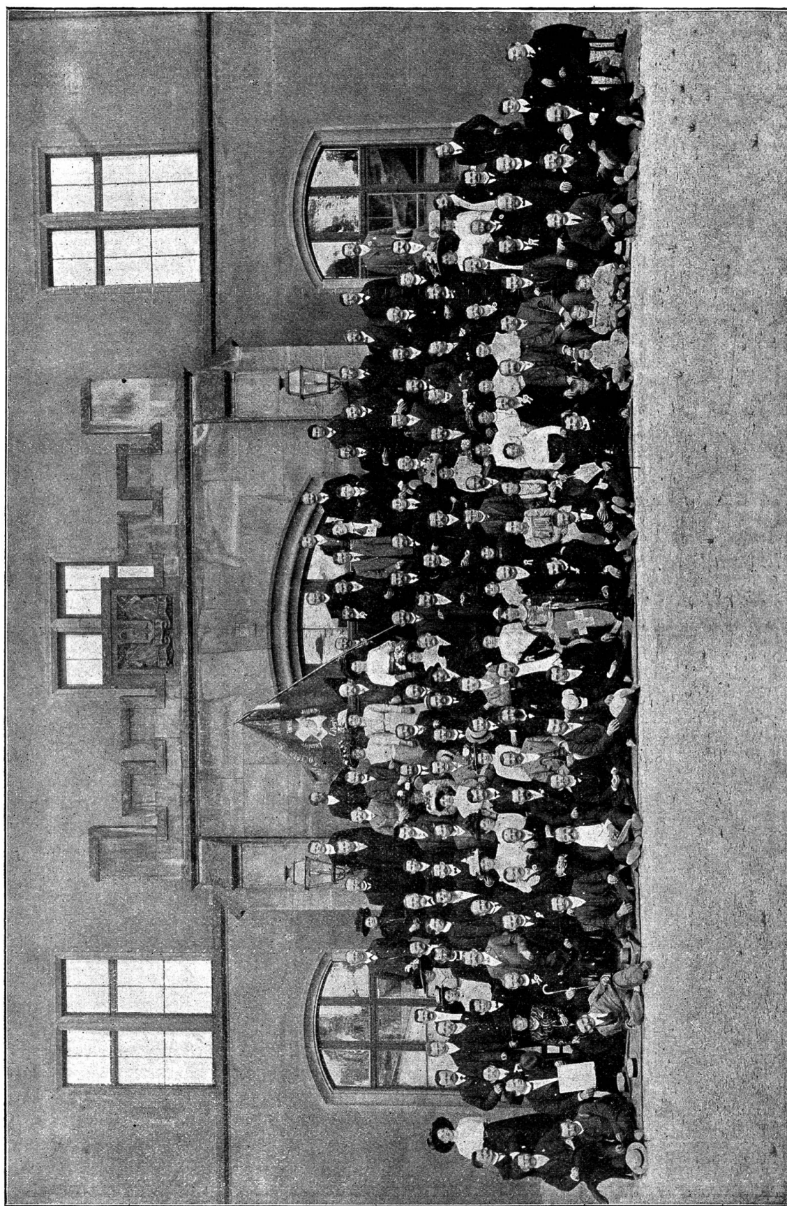
Die Teilnehmer am 10jährigen Stiftungsfest des Bacher Bauhüttenvereins.