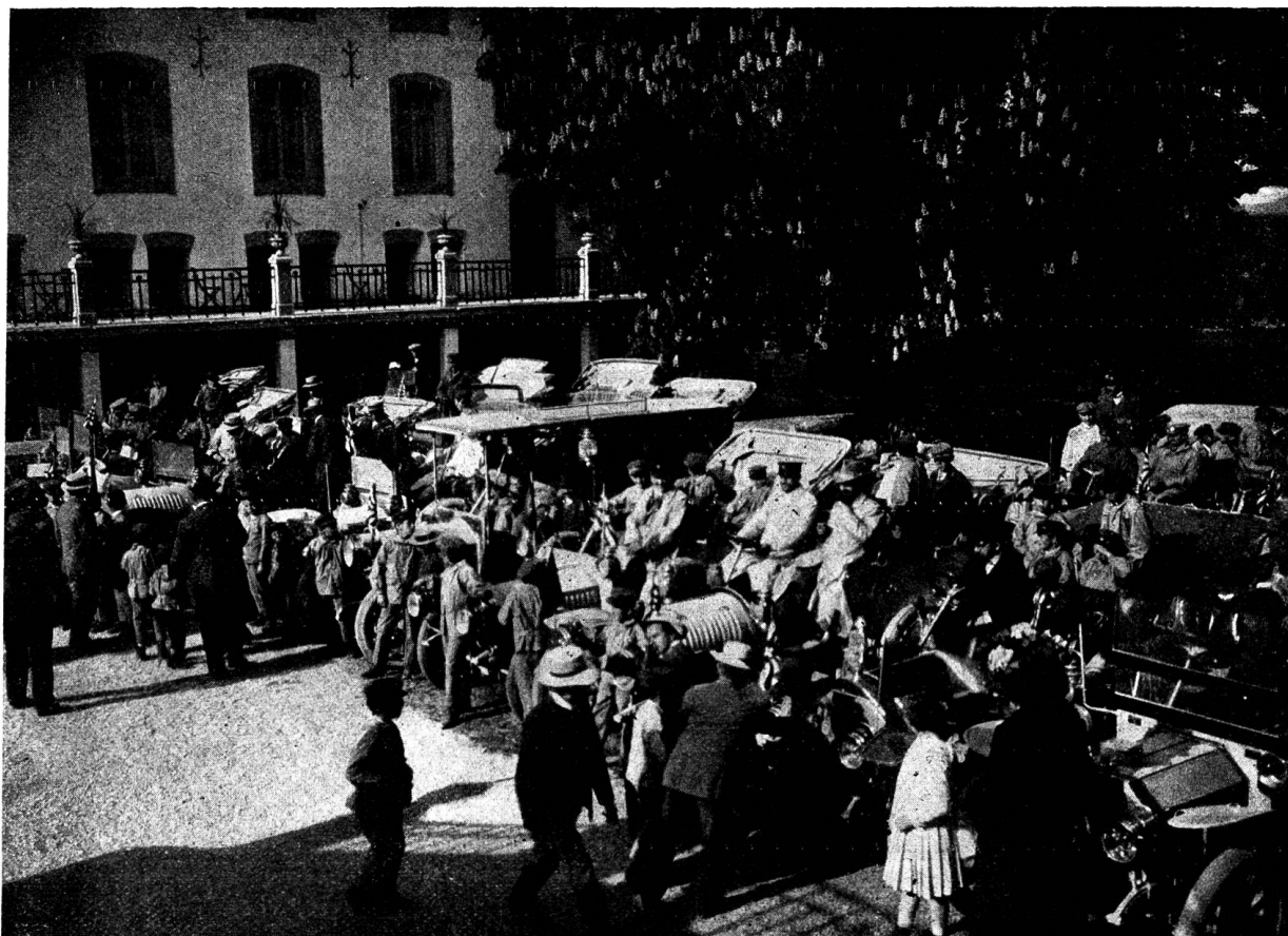
Sammlung zur Rückkehr.