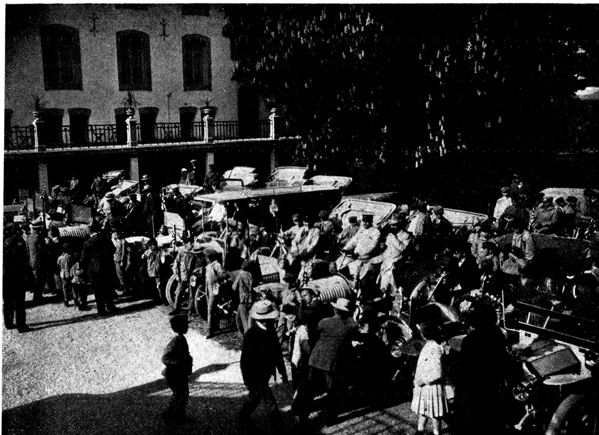
Sammlung zur Rückkehr.