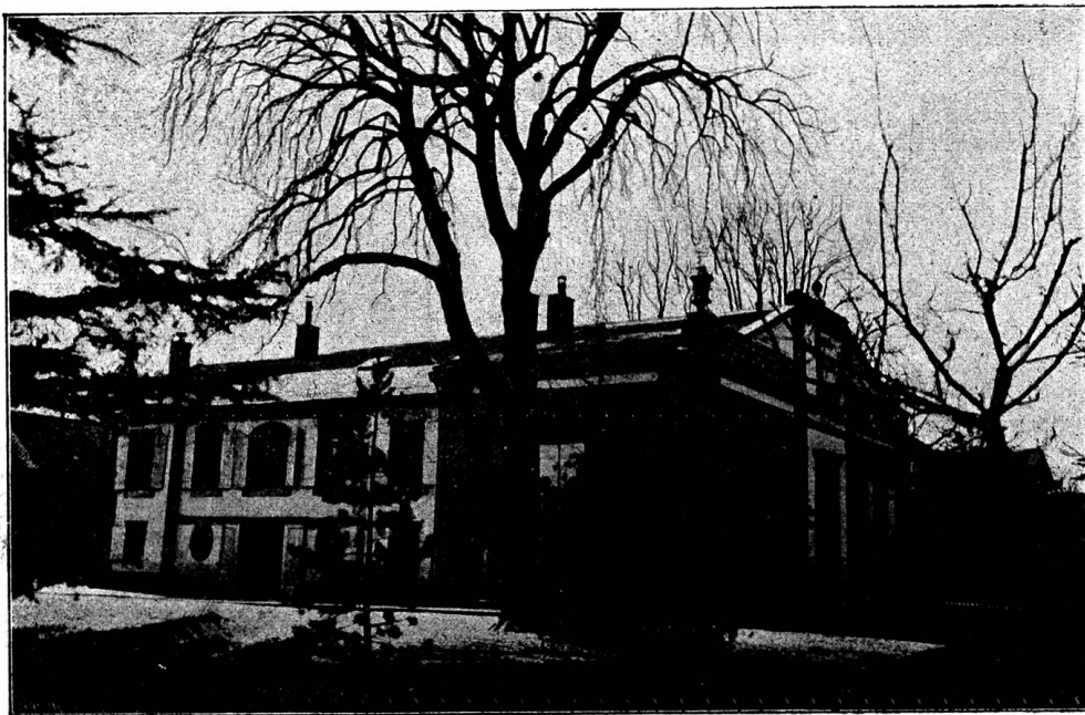
Das noch bestehende Taubstummen-Institut in Genf (Vorsteher: Ed. Junod)

Mittwoch den 9. September. Derselbe Freund ließ es sich nicht nehmen, uns nach dem badischen Freiburg zu begleiten. Freiburg im Breisgau (nicht zu verwechseln mit „Freiburg im Aargau“ in der Schweiz) liegt schön an der Dreisam und zeigt noch manche mittelalterliche Bauten, vor allem das aus