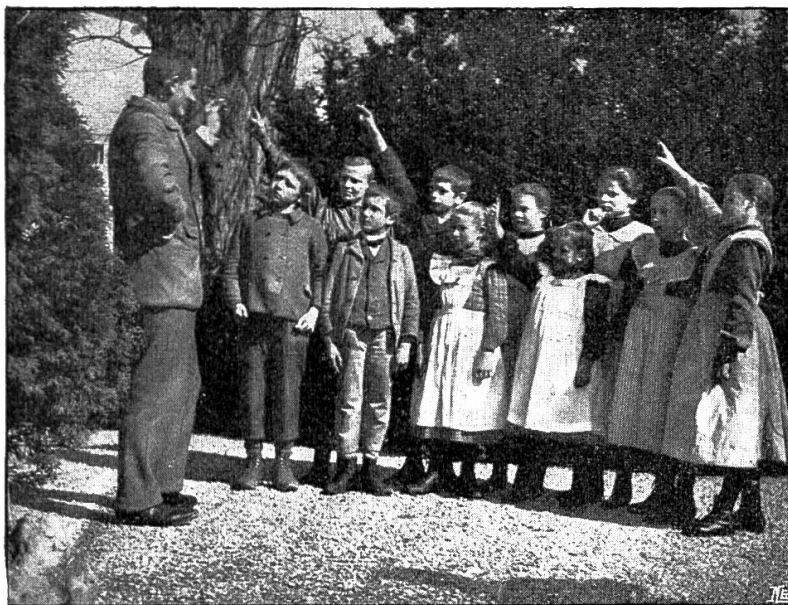
1. Unterricht im Freien.

beträgt somit 8 Jahre. Viele Eltern finden die Zeit erschreckend lang. Nicht selten meint ein Vater oder eine Mutter, ein bis zwei Jahre sollten genügen. Als ob die Volksschule ihre Kinder nicht auch acht Jahre in Beschlag nähme! Wir haben aber das gleiche Unterrichtsziel wie eine tüchtige Volksschule. Ungleich, nämlich schwieriger und mühsamer, ist nur unser Weg.