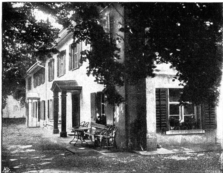
2. Mädchenwohnhaus und Wohnung des Inspektors.