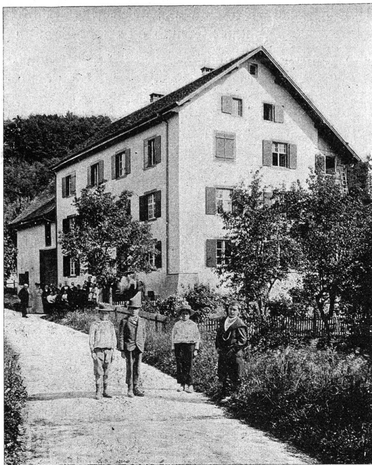
Taubstummenanstalt Bettingen, Vorderseite.