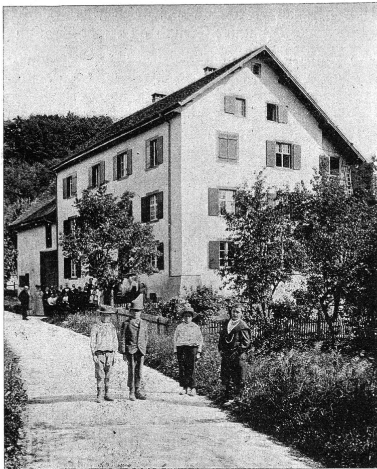
Taubstummenanstalt Bettingen, Vorderseite.