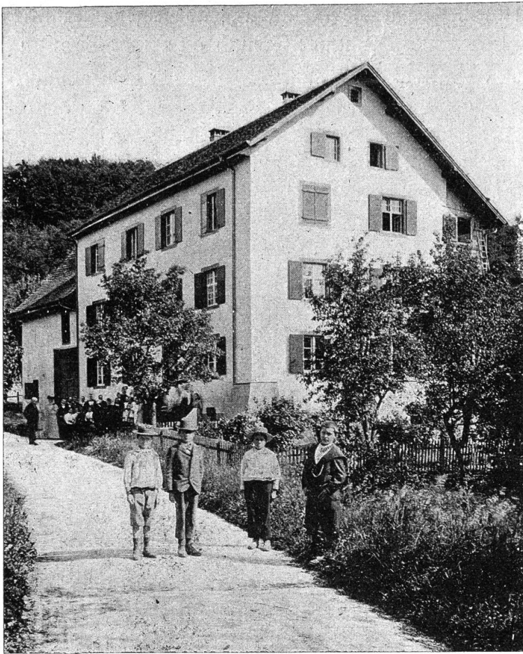
Taubstummenanstalt Riehener, Vorderseite.