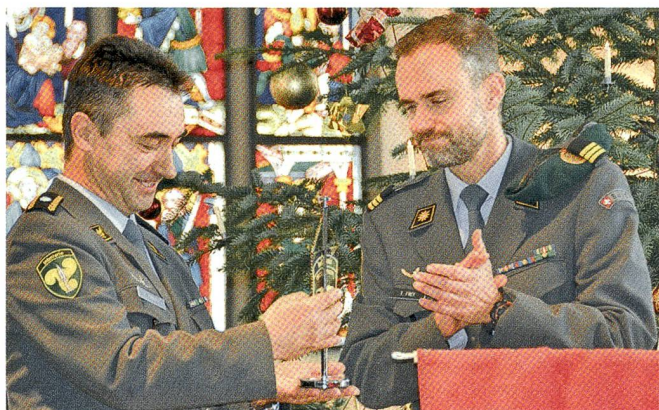
Der Kommandant des Lehrverbandes mit Oberst i Gst Frey.

Landesstatthalter (im Aargau Vizepräsidentin des Regierungsrates) Susanne Hochuli würdigt in einer kurzen, sympa-