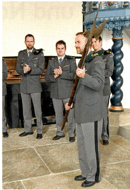
Abtretender Kommandant mit Hellebarde.