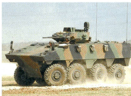
Konkurrent 1: VBCI (Radschützenpanzer).

Das dänische Heer besitzt jetzt schon den Leopard-Kampfpanzer 2A5, den schwedischen Kettenschützenpanzer Hagglunds CV9035 und eine Anzahl Radschützenpanzer Mowag Piranha 3.