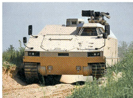
Konkurrent 2: PMMC G5 (Kettenfahrzeug).