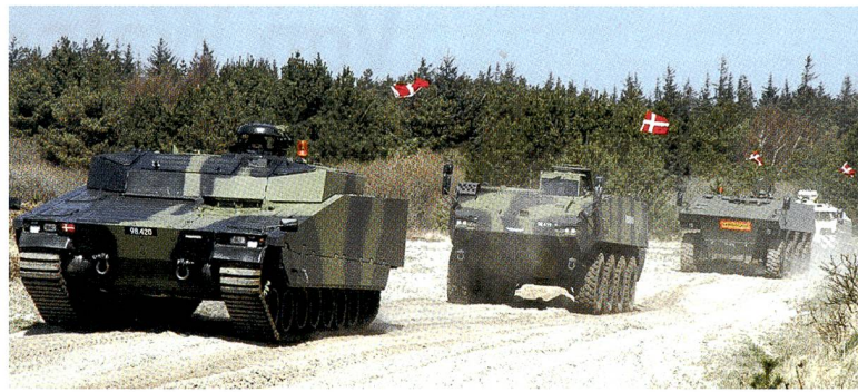
Konkurrenten in der dänischen Evaluation (von vorne): CV90 Armadillo, Piranha 5, VBCI and PMMC G5, alle mit dänischer Fahne.