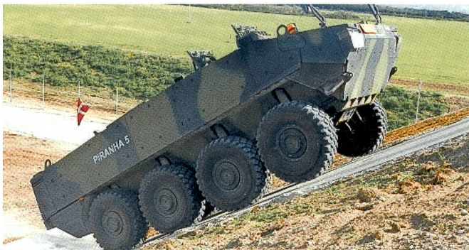
Pluspunkte buchte der Piranha 5 mit seiner Steigfähigkeit.