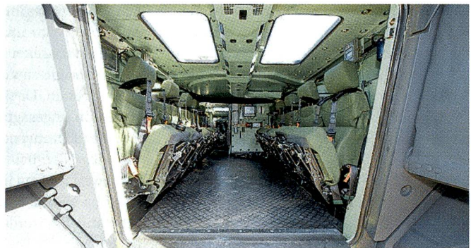
Der Innenraum des Piranha 5: komfortabel für die Truppe.