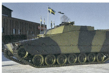
Konkurrent 4: Armadillo CV-90 (Kette).