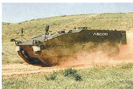
Konkurrent 3: ASCOD-1 (Kettenfahrzeug).