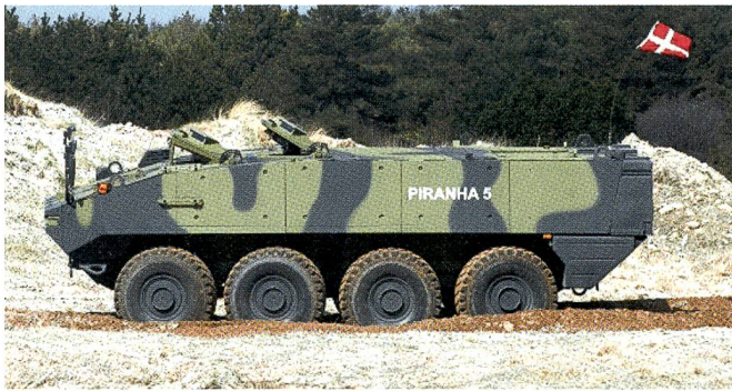
Der Piranha 5 wurde von der dänischen Beschaffungsbehörde in Dänemark einer gründlichen Evaluation unterzogen.