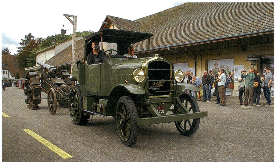
Berna Artillerietraktor mit Radgürtelkanone.

Mit 45 Exponaten zeigte das MiZ die Geschichte der Beschaffung und Verwendung von Motorfahrzeugen der Schweizer Armee und deren enge Verknüpfung mit der Geschichte der schweizerischen Motorfahrzeug- sowie der Schaffhauser Industrie.