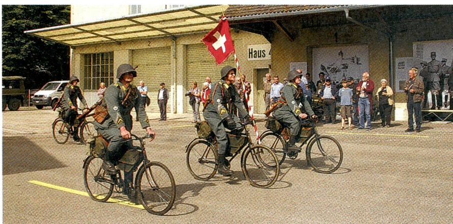
So kamen in der Geschichte die Radfahrer daher.