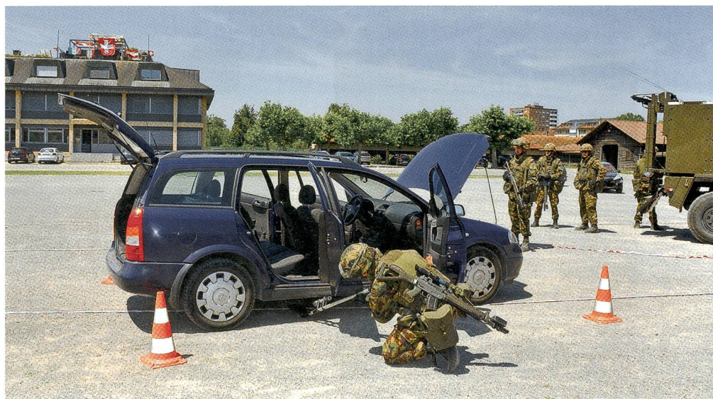
Gründlich nimmt am Checkpoint die Infanterie die Kontrolle des Zivilfahrzeuges vor.