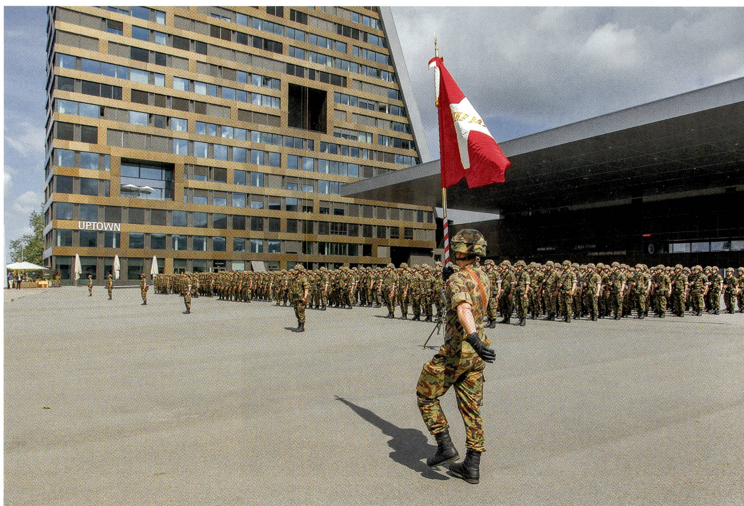
Das stolze Zuger Geb Inf Bat 48 übernimmt in der Kantonshauptstadt Zug vor dem Eishockeystadion des EVZ Zug seine Fahne.