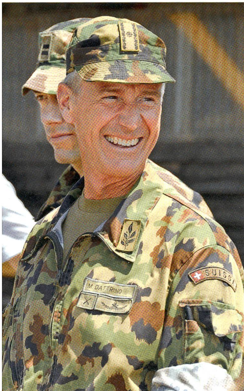
Schwungvoll: Br Dattrino, Kdt Geb Inf Br 9.