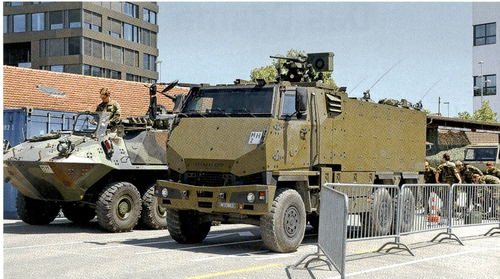
Der Radschützenpanzer Piranha-2 und das Geschützte Mannschaftstransportfahrzeug GMTF.