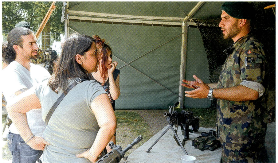
Die zahlreichen Gäste bekunden reges Interesse an der infanteristischen Vorführung.