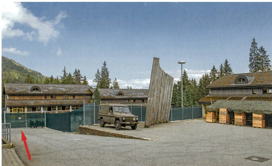
Der grüne Zaun trennt auf dem Glaubenberg streng Asylanten und Soldaten.

Am Haupt-WK-Standort auf dem Obwaldner Glaubenberg wurden die 48er mit einer ganz speziellen Situation konfrontiert: Die Kaserne wird durch einen markanten grünen Zaun durchtrennt. Der untere