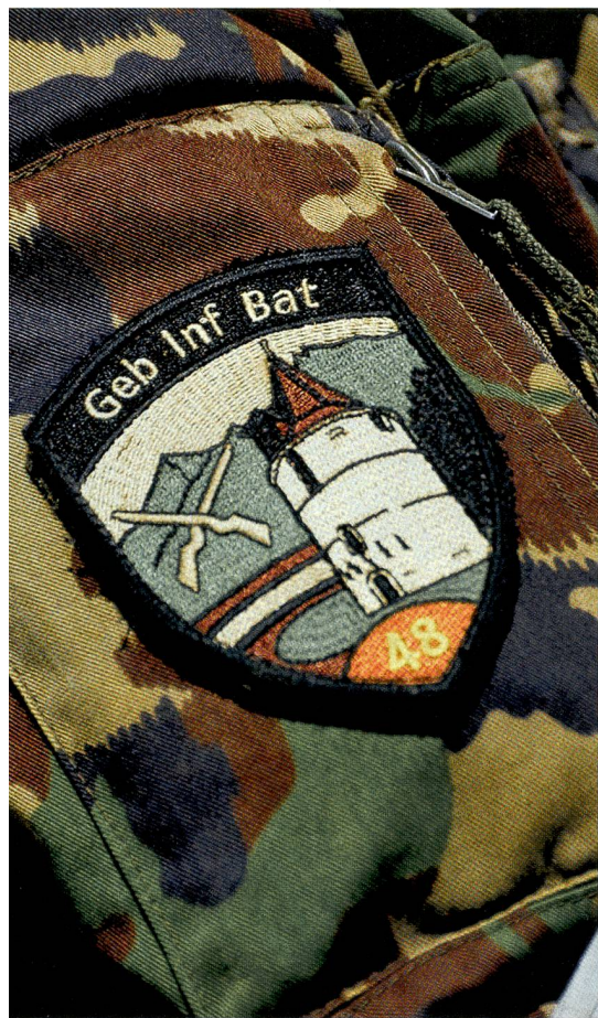
Auf dem rechten Oberarm: Geb Inf Bat 48.