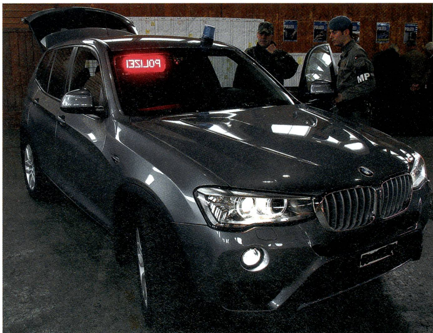
Die Militärpolizei ist auch mit Zivilfahrzeugen ausgerüstet, hier ein BMW.

Der Milizteil Mil Sich gliedert sich aktuell in die MP-Bataillone 1 bis 3, das Schutzdetachment Bundesrat SDBR und das Sicherheitsdetachment Militärpolizei SDMP.