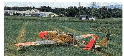
Schweizer Drohne vom Typ ADS-95.