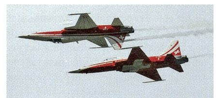
Kühnes Manöver der Patrouille Suisse.