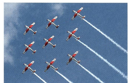
Wie ein Ballett: Das PC-7-Kunstflugteam.