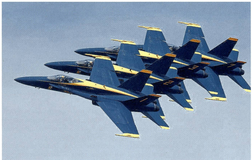
Der Stolz der amerikanischen Marineflieger: Die Kunstflugstaffel Blue Angels .