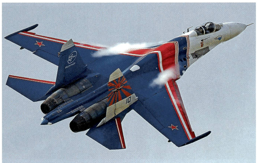
Der Stolz der russischen Fans: Die Russischen Ritter , eine von mehreren Staffeln.

Die Suchoi-27 kommen langsam ins Alter. 2017 sollen die Russischen Ritter auf Suchoi-30 umsteigen. dsa./Moskau