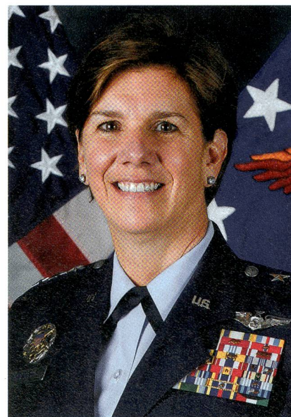
Luftwaffengeneral Lori Robinson, Befehlshaberin des US Northern Command und erster weiblicher Kommandant eines US Combatant Command.

Neben Stabsfunktionen kommandierte sie eine Frühwarn- und Kontroll-Staffel, war Stellvertretende Kommandantin des 405th Air Expeditionary Geschwaders, welches u. a. mit B-1B-Bombern, KC-135-Tankern und E-3-Sentry-Maschinen in den Operationen Enduring Freedom und Iraqi Freedom eingesetzt war. Sie hat zwei Masterdegrees erworben und Studienaufenthalte bei der Brookings Institution und an der Harvard Universität absolviert.