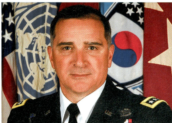
General Curtis «Mike» Scaparotti, der neue SACEUR in Europa.

Er trug dort gleich drei «Hüte», nämlich jenen des Kommandanten aller US-Streitkräfte in Korea, des Kommandanten des Combined Forces Command (Südkoreanisch-Amerikanische Streitkräfte) sowie je-