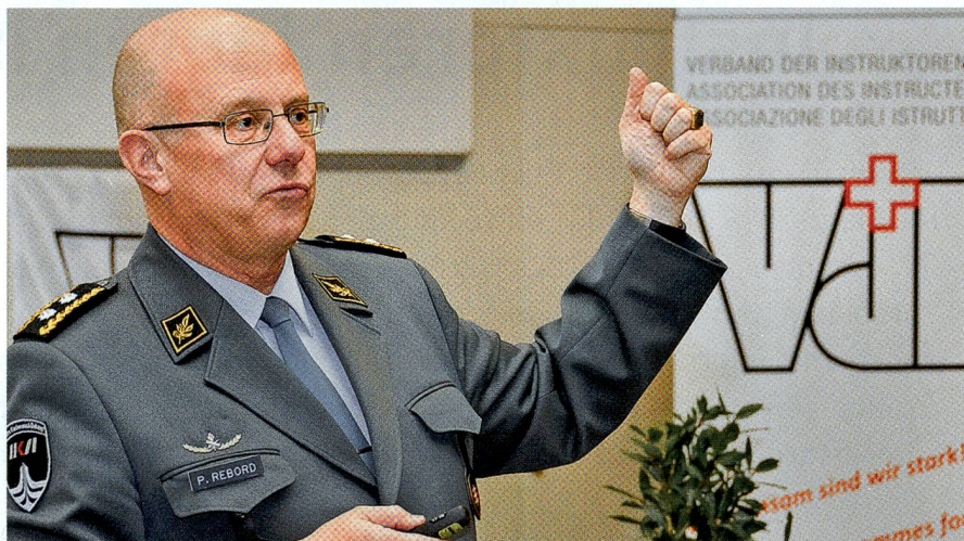
Div Philippe Rebord: Starke Aussagen des «Hausherrn» im AAL.

Über die Rüstungsplanung kommt Rebord auf die Flugzeugbeschaffung zu sprechen: «Das nächste Mal, wo wir über die Luftwaffe sprechen, diskutieren und entscheiden wir nicht mehr über einen Flugzeugtyp wie letztmals beim Gripen, sondern über die Frage «Luftwaffe ja oder nein?», denn die F/A-18 werden bis dann