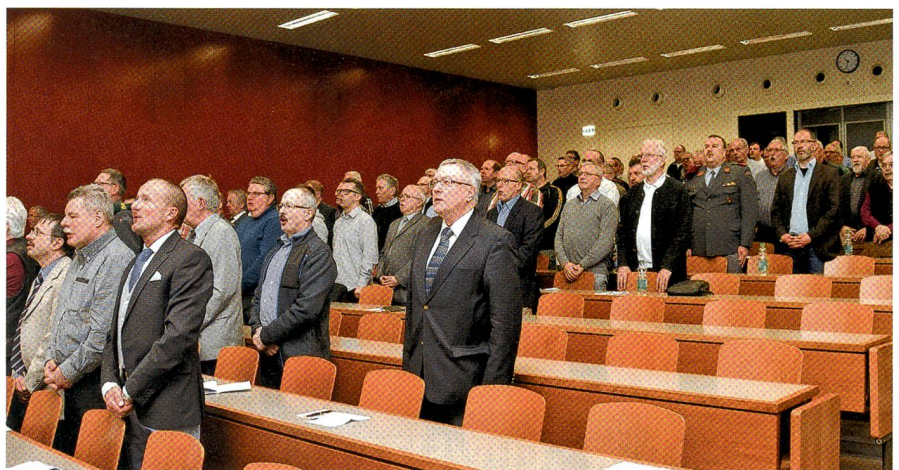
Das gemeinsame Singen des Schweizerpsalms zu Beginn des Anlasses.

Dieses Geschäft sei jetzt beim neuen Finanzvorsteher Bundesrat Ueli Maurer,