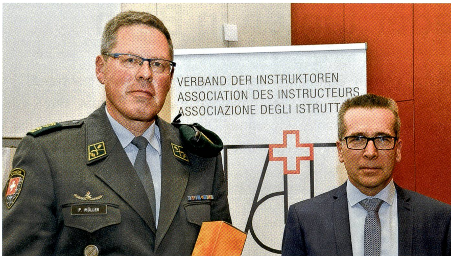
Dank an Chefadjutant Pius Müller durch Präsident Etienne Bernard.

etwa 120 000 bei uns an der Südgrenze! Ein Blick auf die geografische Lage der gegenwärtigen Auffanglager in Vallorbe, Basel, Kreuzlingen, Buchs und Chiasso, die wöchentlich je 1000 Flüchtlinge aufnehmen sollen, zeigt, dass die gesamte Aufnahmekapazität einerseits viel zu gering sein könnte und dass das Bundesamt für Migra-