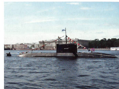
Konventionelles U-Boot Amur-1650 mit aussenluftunabhängigem Antrieb.

Die Ausschreibung war im September 2011 bekanntgegeben worden. Russland schliesse derzeit die Tests einer grundsätzlich neuen aussenluftunabhängigen An-