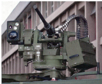
Oto Melara Hitrole mit schwerem MG im Kaliber 12,7 mm.

Oto Melara ist vom italienischen Verteidigungsministerium mit der Lieferung von 40 fernbedienten Waffenstationen Hitrole für die Ausstattung des geschützten 4x4-Radpanzers VTMM, einer Gemeinschaftsproduktion von Iveco und Krauss-Maffei Wegmann, beauftragt worden. Hitrole ist eine elektrisch ferngesteuerte Waffenstation für ein 12,7-mm-Maschinengewehr oder einen