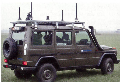
Cassidian «Vehicle Protection Jammer» auf einem Versuchsfahrzeug.

Der «Vehicle Protection Jammer» von Cassidian basiert auf der neuen superschnellen «Smart Responsive Jamming Technology», einer intelligenten Störautomatik, die das Schutzniveau drastisch erhöht. Das System erfasst und klassifiziert Funksignale, die zur Zündung von Strassenbomben gesendet werden. Daraufhin emittiert es in Echtzeit Störsignale, die exakt auf das feindliche Frequenzband zugeschnitten sind. Dank neuen digitalen