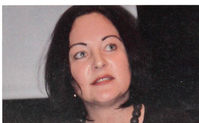
... und Burn-out können wir ankämpfen ...