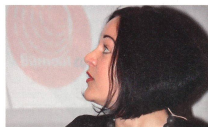
... wir müssen das nur wollen!»