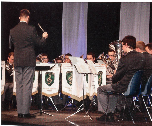
Das Rekrutenspiel 16/2 spielte den Schaffhausermarsch.