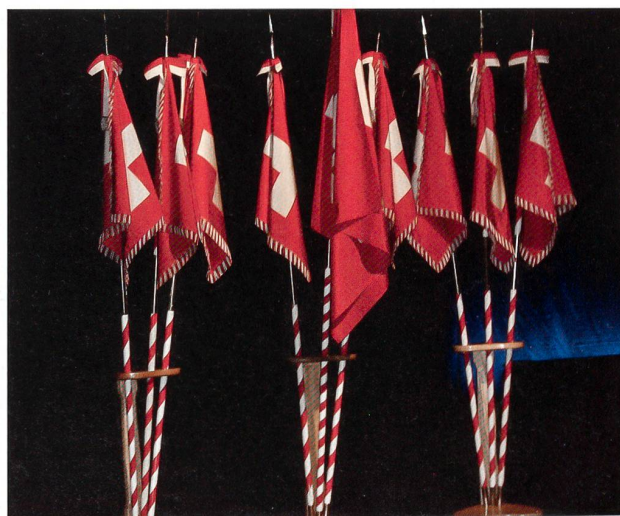
Die Feldzeichen, acht Standarten und die Fahne des Inf Bat 61.