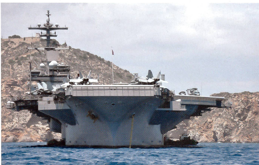
Der neueste Atomflugzeugträger der US Navy, die USS «George H.W. Bush» (CVN 77), ankert vor der spanischen Stadt Cartagena, bereit zum Auslaufen. An Bord sind gegen 70 Flugzeuge des Marinefliegergeschwaders 8.

Die aufflammenden Unruhen in Ägypten, Tunesien und Libyen sollten keinen Einfluss auf die geplanten Übungsaktivitä-