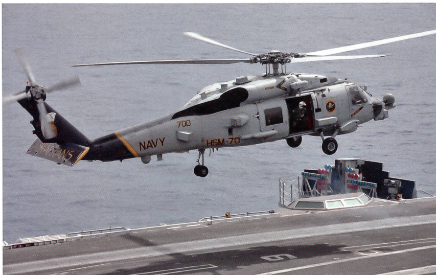
Ebenfalls neu an Bord sind die Helikopter des Typs MH-60R Knighthawk der Helicopter Maritime Strike Squadron HSM-70.

und erhöht die Geschwindigkeit auf etwa 20–25 Knoten, um den Maschinen einen besseren Auftrieb zu verschaffen. Es kann je nach Windrichtung vorkommen, dass der Träger für die Dauer der Start- und Landesequenz einen Kurs steuert, der bis zu 180 Grad vom eigentlichen Kurs abweicht.