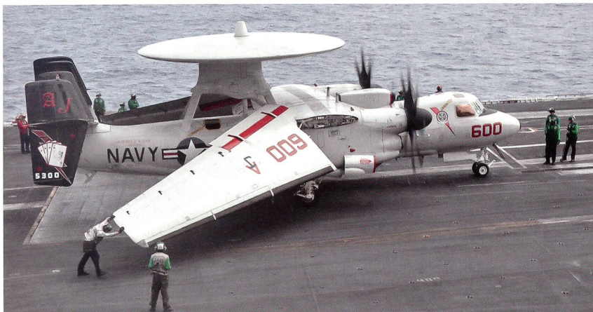
Eine Radarfrühwarnmaschine des Typs E-2C Hawkeye der Staffel VAW-124 rollt zum Katapultstart.