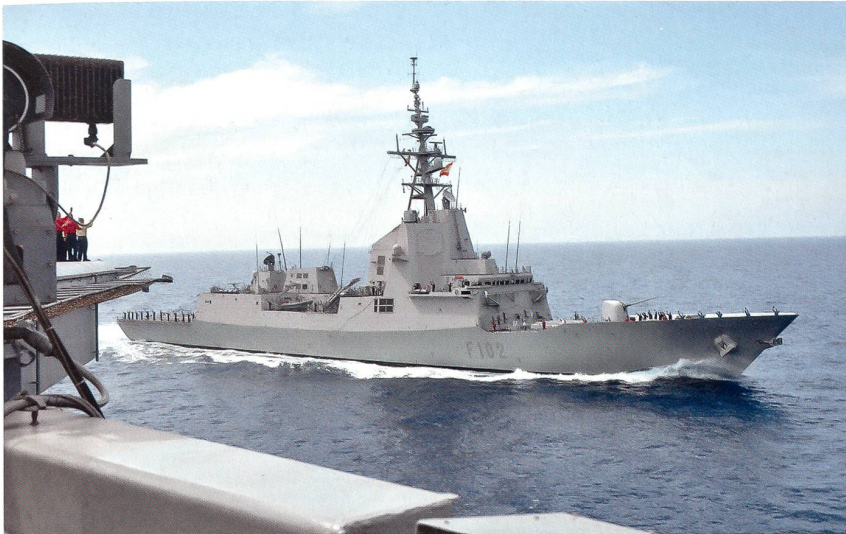
Die spanische Fregatte «Almirante Juan de Borbon» (F 102) war stets in Sichtweite des Flugzeugträgers GHWB und bildete dessen unmittelbaren Schutzschirm.