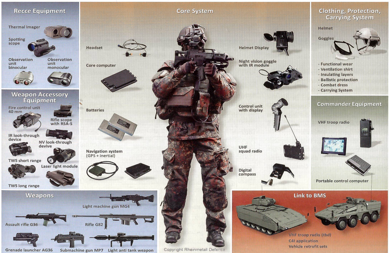
Die Darstellung zeigt die Grundausrüstung von GLADIUS und die verschiedenen Möglichkeiten zur Erweiterung des Systems, welche je nach Auftrag und Funktion möglich ist.

Im sogenannten Depot neben dem Neubau befinden sich zahlreiche Fahrzeuge aus verschiedenen Ländern, darunter auch ein Centurion aus der Schweiz. Das Depot steht nicht allen Besuchern offen. Es wird nur besonders Interessierten, betreut von fachkundigen Führern, gezeigt. +