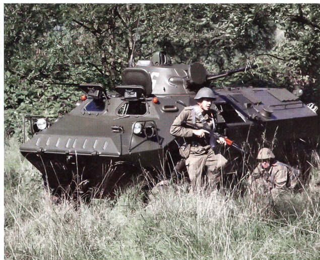
Der ungarische Radpanzer PSZH klärt auf – am Rhein!