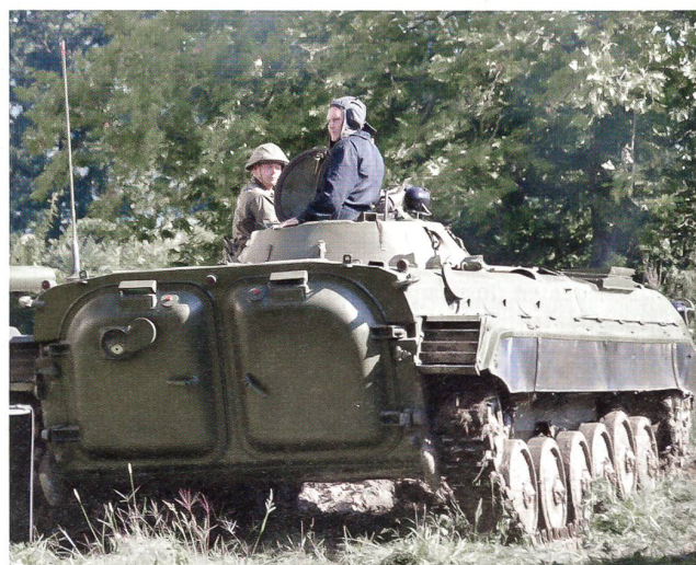
Der russische Schützenpanzer BMP-1 mit seinen beiden Hecktüren. Auch der BMP-1 gelangt in Syrien zum Einsatz.