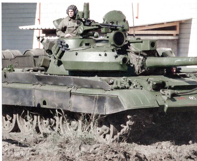
Der gefürchtete russische Kampfpanzer T-72. Im syrischen Bürgerkrieg setzen die Asad-Streitkräfte dieses Modell ein.