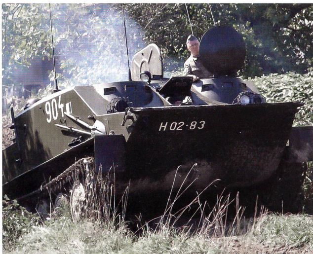
Russischer Schützenpanzer BTR-50 PU, aus Ungarns Armee.