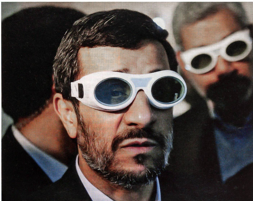
Der iranische Präsident Ahmadinedschad, gut geschützt bei einer Laser-Vorführung.

Eine Zerstörung hätte also die Verstrahlung grosser Gebiete des Iran, aber auch von Teilen angrenzender Golfstaaten zur Folge.