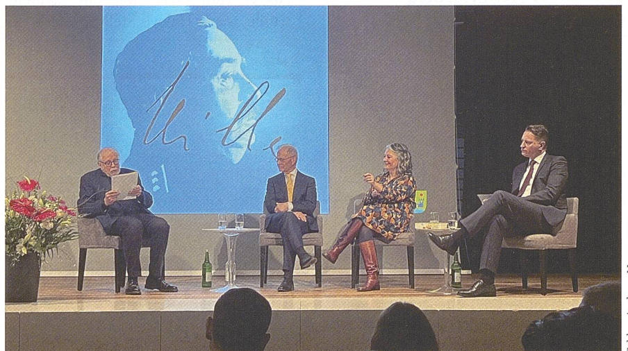
Podiumsdiskussion anlässlich des Todestages General Ulrich Willes.

In seiner Festansprache ging der Chef der Armee, Korpskommandant Thomas Süssli, auf die Bedeutung General Ulrich Wil-