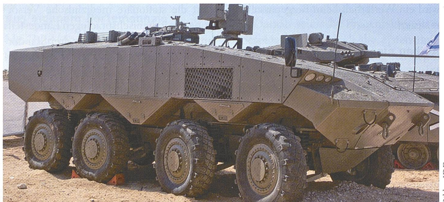
Israels neuer Schützenpanzer Eytan ersetzt die alten M113. Gebaut wird er von IAI, IMI und Rafael. Drei Mann Besatzung plus zwölf Infanteristen. 30-mm-MK-44-Kanone, Maschinengewehr 7,62 mm.

Im Januar tat Herzl Halevi kund, er werde den Befehl über die Streitkräfte am 6. März niederlegen. Er ziehe die Konsequenzen aus den Fehlern der Armee am 7.