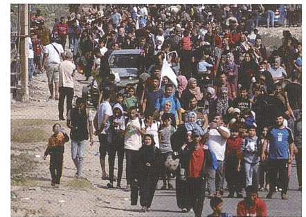
Nach der Öffnung der Süd-Nord-Verbindungen: Die arabische «Völkerwanderung».