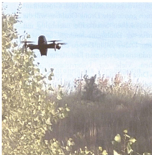
bis Tausende Drohnen ein, sowohl zivile als

So gelang es den ukrainischen Streitkräften auch im Jahr 2024, eine der modernsten russischen Korvetten, die «Sergej Kotow», deren Beschaffungskosten auf über 60 Millionen Euro geschätzt werden, von mehreren (mit Sprengsätzen beladenen) Magura-Kamikaze-Drohnenbooten,