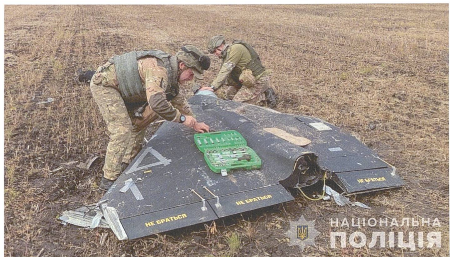
Im November 2023 führten die russischen Streitkräfte den bis dahin grössten Drohnenangriff durch und setzten dabei rund 75 Shahed-Drohnen ein.