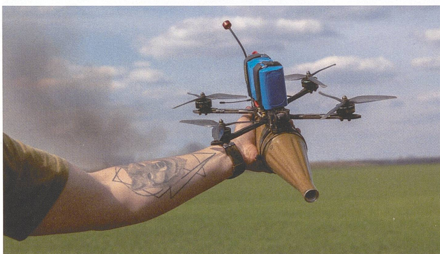
Seit Februar 2022 nutzen die ukrainischen Streitkräfte verstärkt zivile Drohnen, die mit Sprengladungen ausgestattet werden.

Weil Kampfflugzeuge wegen der Flugabwehr oftmals nicht eingesetzt werden, haben Drohnen als unbemannte Systeme eine besondere Rolle in diesem Krieg erhalten. Die Bandbreite der Drohnen im Ukrainekrieg reicht von sehr kleinen Drohnen - beispielsweise der «Black Hor-