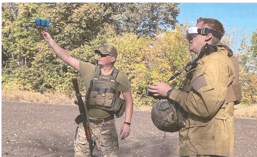
Ukrainische Streitkräfte verlieren teilweise bis zu 10 000 Drohnen pro Monat, da viele zivile Systeme nicht lange auf dem Schlachtfeld überleben.