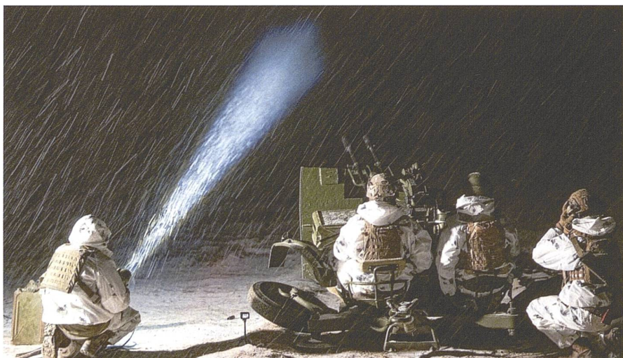
Zur Drohnenabwehr setzen die ukrainischen Streitkräfte improvisierte Lösungen wie akustische Detektionssysteme und mobile Teams mit Schrotflinten ein.

die selbst jeweils rund 250 000 Euro kosten, zu zerstören.