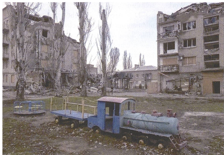
Zerstörungen in der ostukrainischen Stadt Pokrovsk.

Eine Auswertung verschiedener Szenarienmodelle und Simulationen ergibt als aktuell am wahrscheinlichsten, dass der Russland-Ukraine-Krieg mittelfristig in einem Patt in Form eines eingefrorenen Krieges endet, bei dem es zu einer de facto-Teilung der Ukraine kommt. Langfristig wäre dann abzuwarten, wie sehr der Westen das verbliebene ukrainische Staatsgebiet mit Sicherheitsgarantien schützt und ob sich die russische Regierung damit zufrieden gibt, etwa 20% des ursprünglichen ukrainischen Staatsgebietes erobert zu haben und zu kontrollieren. +