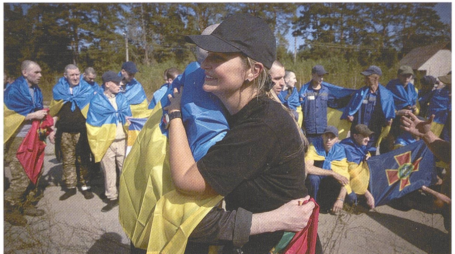
Aus russischer Gefangenschaft heimgekehrte ukrainische Soldaten.

Innerhalb der ukrainischen Regierung, aber auch in den ukrainischen Streitkräften, geht die Angst um, dass der neue US-Präsident die US-Militärhilfe an die Ukraine drastisch minimieren könnte. Trump hatte während des Wahlkampfs wiederholt angekündigt, er könne den Krieg in der Ukraine innerhalb von 24