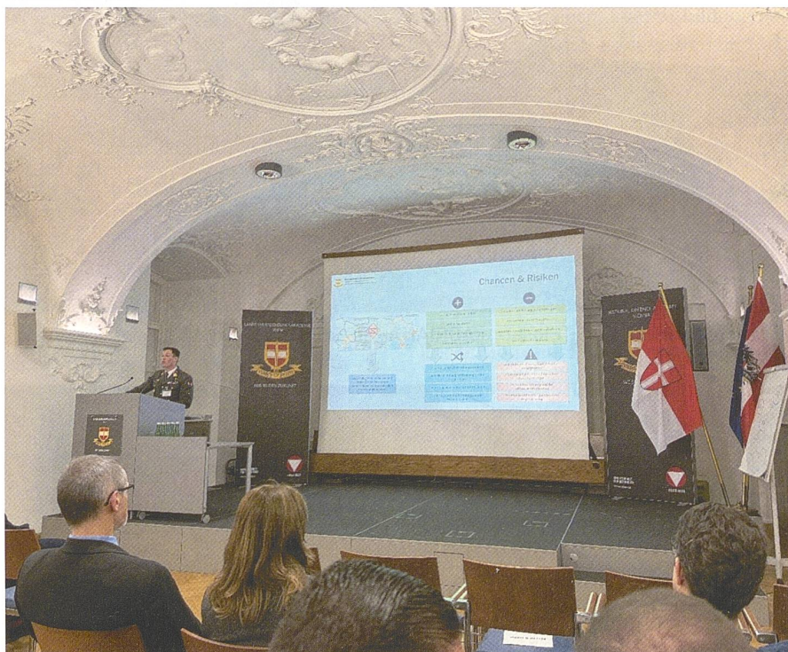
Immer wieder geht es um die Beurteilung von Chancen und Risiken.

Österreichs Neutralität wurde auf der Tagung sowohl als Stärke als auch als Herausforderung beschrieben. In einer zunehmend vernetzten Welt, in der die Grenzen zwischen Allianzen und Neutralität verschwimmen, stellt sich die Frage, wie Österreich seine Souveränität und Unabhängigkeit bewahren kann. Die Experten verglichen Österreich mit den baltischen Staaten, die durch ihre geografische Lage gezwungen sind, enge Bündnisse einzugehen, um ihre Sicherheit zu gewährleisten. Österreich hingegen kann sich Neutralität leisten – aber nur, solange diese durch operative Tiefe und strategische Resilienz abgesichert ist. Neutralität darf nicht bedeuten, sich von internationalen Entwicklungen abzukoppeln. Vielmehr muss Ös-