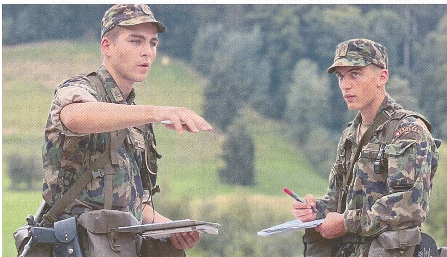
Klare Kommunikation ist ein Schlüssel zum Erfolg.