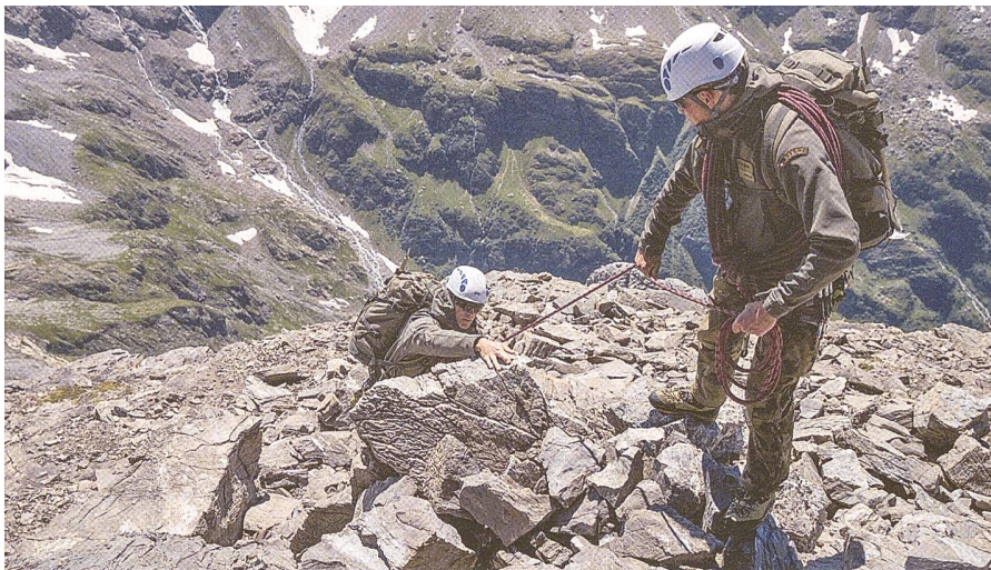
Probleme werden gemeinsam gelöst.