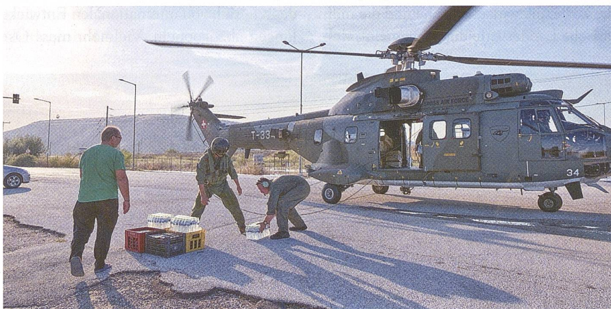
Katastrophenhilfe 2023: Einsatz «ADRIANA» in Griechenland.