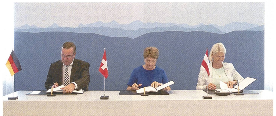
Unterzeichnung der «EUROPEAN SKY SHIELD INITIATIVE».

Am Samstagmorgen dann der Höhepunkt im Leben der Dorfjugend: die Materialkontrolle auf dem Schulhausplatz. Was für ein Vergnügen war es doch, miterleben zu dürfen, wie der Feldweibel gestandene Männer zusammenstauchte, wenn eine Gabelle nicht gerade ausgerichtet war oder gar ein Taschenmesser nicht blitzblank vorgewiesen wurde! Am Samstagabend dann, beim Unterhaltungsabend des Turnvereins, sass die Hälfte des männlichen Publikums in der Ausgangsuniform vor den Bierkrügen, für die sie selbstverständlich nur die Hälfte des Preises zu be-