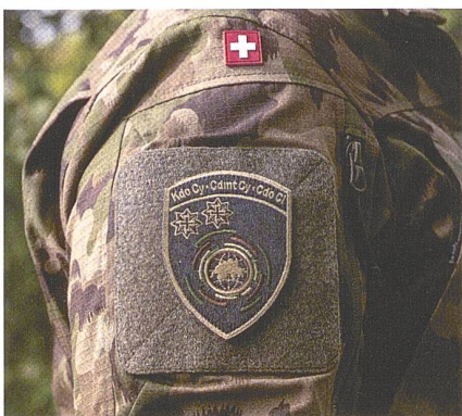
Die Bedeutung des Cyber-Raumes wurde erkannt.

Zum Schluss richten wir den Blick auf uns selbst, auf unsere Gesellschaft. Die Armee des Jahres 2025 ist weit weg davon, von der Bevölkerung als geschätztes Instrument zur Wahrung der Sicherheit gesehen zu werden, sofern sie überhaupt gesehen wird. Lehrer, die gleichzeitig Offizier sind, gehören einer aussterbenden Spezies an. Schlimmer noch, es gibt in unserem Land sogar Schulleitungen, die ihrem Personal ganz offiziell verbieten, sich in ihrer Institution jemals in Uniform zu zeigen. Geschichtsunterricht und Staatskunde sind aus den Lehrplänen verschwunden – mit der Folge, dass die jungen Erwachsenen von Sicherheitspolitik keine Ahnung haben und allen Ernstes behaupten, Wohlstand und Sicherheit seien reine Glückssache. Wer so denkt, erkennt den Wert nicht und ist jederzeit bereit, das zuvor mühsam Errungene zu verscherbeln. Somit wird zur Nebensache, wer im Bundesrat sitzt, denn nur etwas kann helfen: Über die Bildung müssen wir den kommenden Generationen vermitteln, wie unser System funktioniert, damit sie erkennen, welcher Beitrag zur Sicherheit zu leisten ist. +