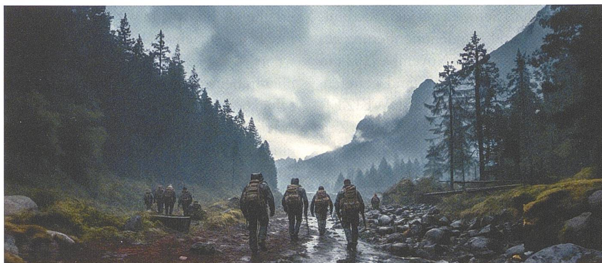
Noch immer meilenweit entfernt von Ueli Maurers «Besten Armee der Welt».