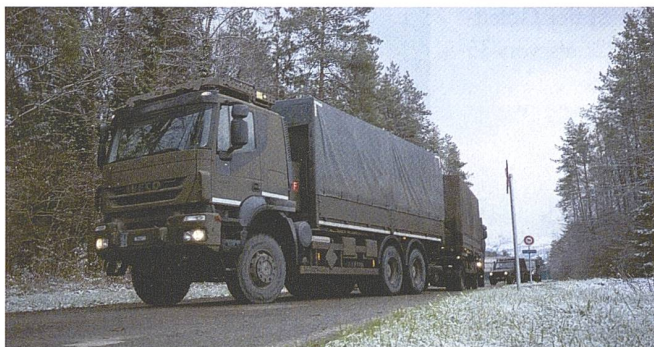
Der IVECO Trakker 6x6 hat eine Nutzlast von neun Tonnen.