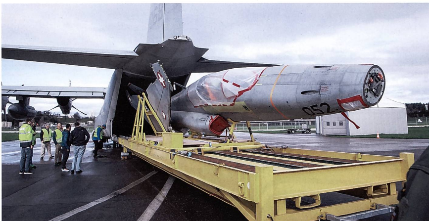
Die U.S. Navy fliegt mit F-5-Flugzeugen.

Die U.S. Navy vergab im Juli 2022 den Auftrag für das F-5-Modernisierungsprogramm ARTEMIS an Tactical Air. RUAG ist als Unterlieferant von Tactical Air für spezifische Instandhaltungsleistungen an den F-5-Flugzeugzellen sowie für die Überholung der GE-J-85-Triebwerke zuständig. Die 22 F-5-Flugzeuge erwarb die U.S. Navy bereits vor mehreren Jahren von der Schweizer Regierung.