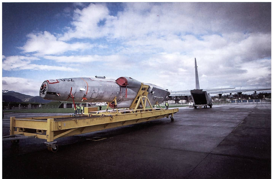
Der erste F-5-Jet konnte an Tactical Air für die weiteren Arbeiten nach Jacksonville, Florida, ausgeliefert werden.