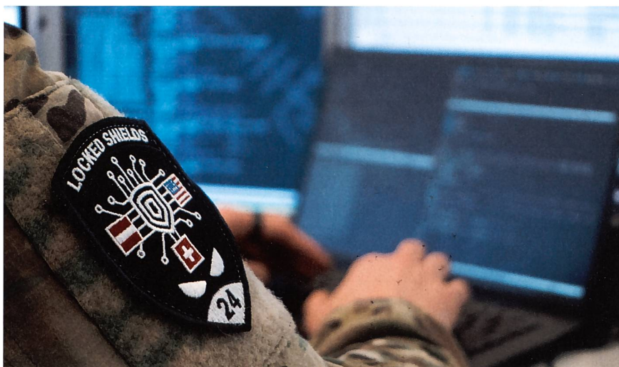
Die European Sky Shield Initiative wurde von Deutschland initiiert.

Medienmitteilung Kommunikation Verteidigung