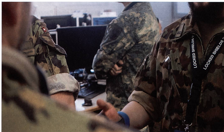
Die Schweiz nimmt seit 2010 regelmässig an «Locked Shields» teil.