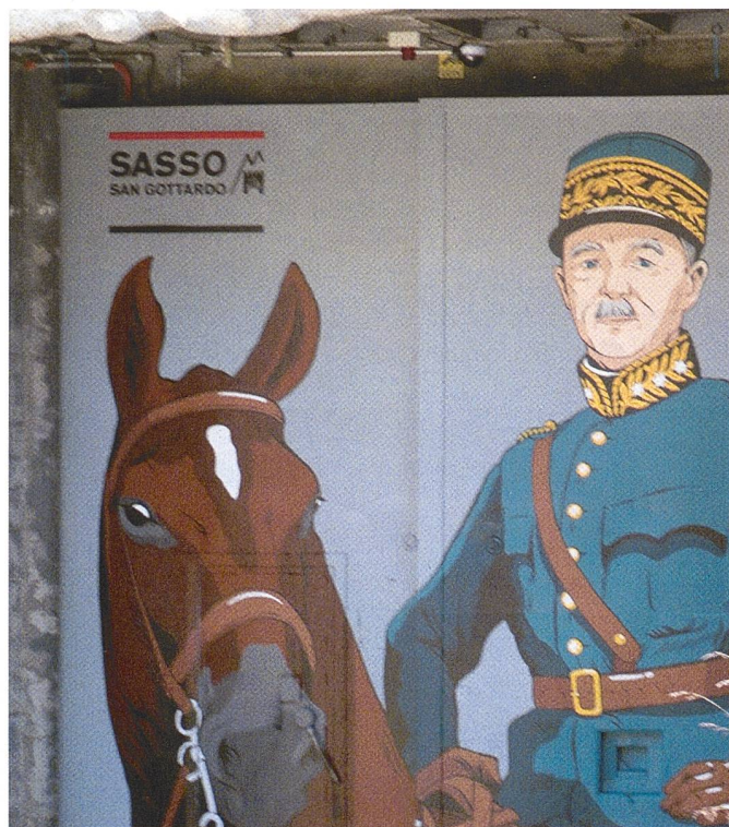
Aussensicht auf das neue Mural: Es zeigt General Guisan mit «Nobs».