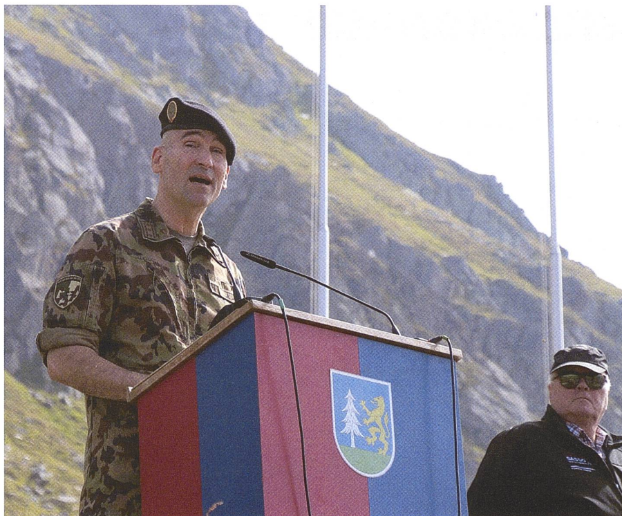
KKdt Süssli: Es geht um die vollständige Ausrüstung und nicht um Aufrüstung.

te, wie Guisan es verstand, die Schweiz über alle Sprachgrenzen und kulturelle Differenzen hinweg auf ein gemeinsames Ziel zu vereinen. Markus Somm, ebenfalls bekannt als Chefredaktor des Nebelspalters, hielt in seiner Rolle als Biograph von General Guisan eine Rede. Somm schlossfolgerte in seinem Werk «General Guisan, Widerstand nach Schweizer Art» wie Guisan zum «Vater des Vaterlandes» wurde.