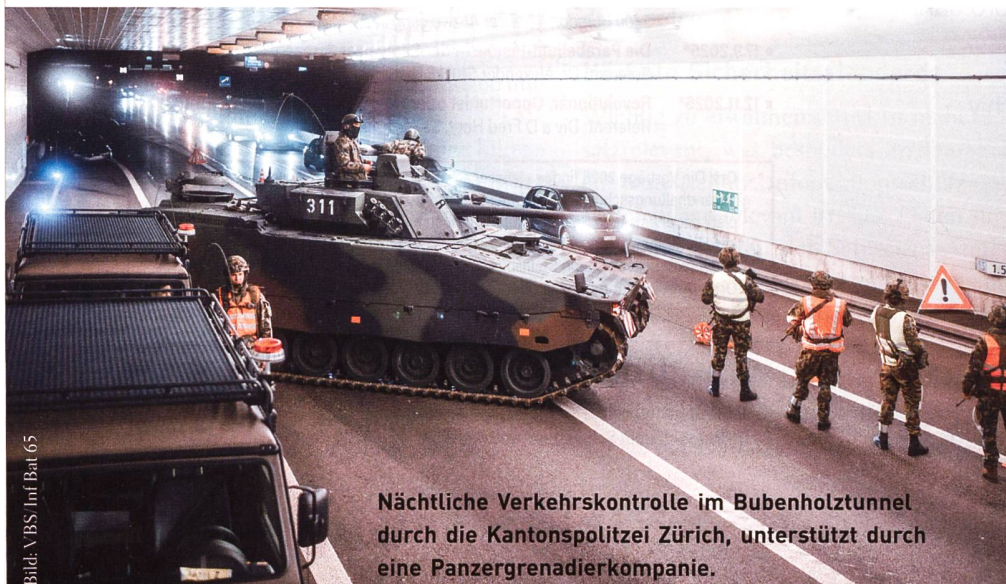
Nächtliche Verkehrskontrolle im Bubenholztunnel durch die Kantonspolizei Zürich, unterstützt durch eine Panzergrenadierkompanie.