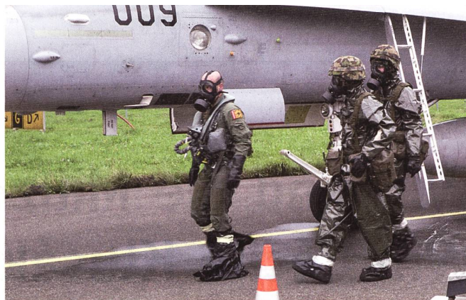
Im FDT 2024 wurden rund 40 ABC-Spürer direkt von den ABC-Verantwortlichen des Flugplatzes spezifisch weitergebildet.

sogenannte HOTLINE statt. Im Bereich WARM wird die eigentliche Dekontamination durchgeführt. Begonnen wird mit der Dekontamination der Fussbekleidung des Piloten. Mit Hilfe der ABC-Spürer durchquert der Pilot drei aufeinanderfolgende Fussbecken. Anschliessend wird der Pilot mit einem Nachweisgerät vermessen, um sicherzustellen, dass kein Kampfstoff mehr vorhanden ist. Im Falle eines Nachweises von C-Kampfstoffen müsste der Pilot diese Station erneut durchlaufen. Als nächstes folgt der Eintritt des Piloten in die beiden Airshelter. Dort wird die gesamte Ausrüstung und Bekleidung des Piloten schrittweise entfernt. Am Ausgang des Airshelters befindet sich der STEPOVER zum Bereich COLD. Dort angekommen, erhält der Pilot saubere Notwäsche und ist bereit zum Retablieren.