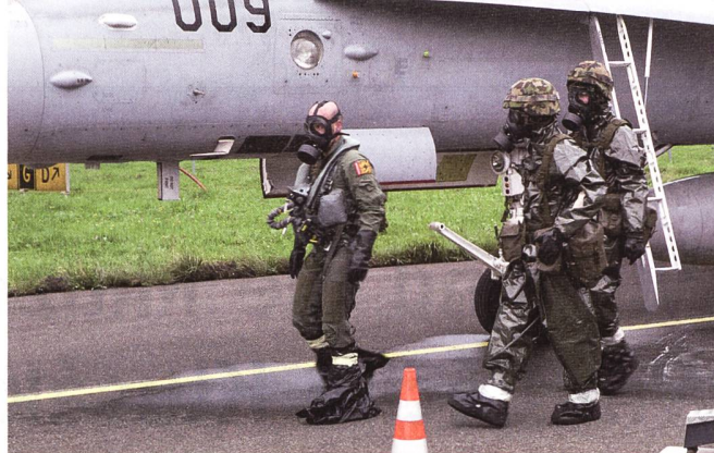
Im FDT 2024 wurden rund 40 ABC-Spürer direkt von den ABC-Verantwortlichen des Flugplatzes spezifisch weitergebildet.

sogenannte HOTLINE statt. Im Bereich WARM wird die eigentliche Dekontamination durchgeführt. Begonnen wird mit der Dekontamination der Fussbekleidung des Piloten. Mit Hilfe der ABC-Spürer durchquert der Pilot drei aufeinanderfolgende Fussbecken. Anschliessend wird der Pilot mit einem Nachweisgerät vermessen, um sicherzustellen, dass kein Kampfstoff mehr vorhanden ist. Im Falle eines Nachweises von C-Kampfstoffen müsste der Pilot diese Station erneut durchlaufen. Als nächstes folgt der Eintritt des Piloten in die beiden Airshelter. Dort wird die gesamte Ausrüstung und Bekleidung des Piloten schrittweise entfernt. Am Ausgang des Airshelters befindet sich der STEPOVER zum Bereich COLD. Dort angekommen, erhält der Pilot saubere Notwäsche und ist bereit zum Retablieren.