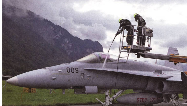
Die F/A-18 Hornet wird mit einer Dekontaminierungslösung besprüht.