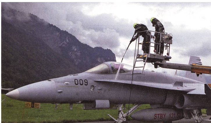
Die F/A-18 Hornet wird mit einer Dekontaminierungslösung besprüht.