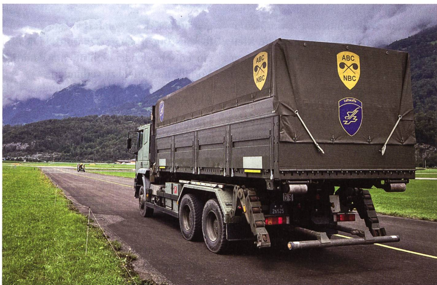
WABRB mit Dekontaminationssystem.

Der Dekontaminationsprozess erstreckt sich über drei Zonen. Diese drei Zonen bilden die Contamination Control Area, kurz CCA. Aufgeteilt werden diese Sektoren mit HOT, WARM und COLD bezeichnet. Der Sektor HOT gilt als vollständig kontaminiert. Von dort aus findet ein Übergang zum Sektor WARM über die